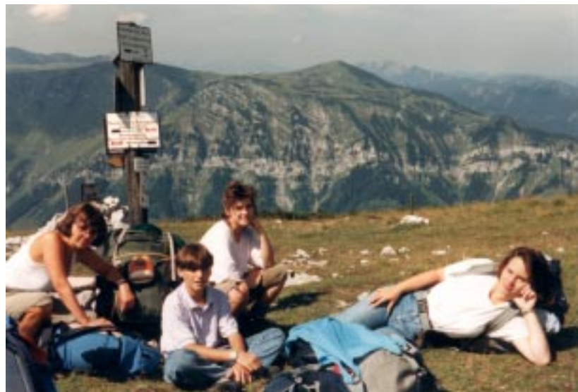
Mariazellfußwallfahrt 1988 - Rast vor dem Gamsecksteig